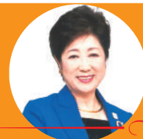
東京都知事 小池 百合子