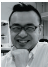
Laurin Lab CEO